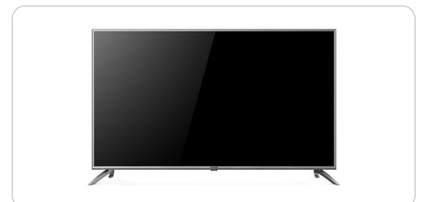
Телевизор с функцией Smart TV