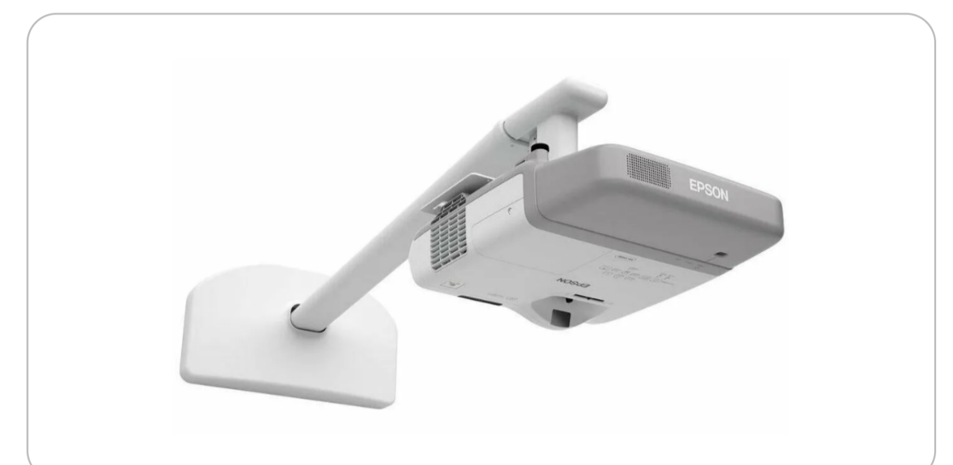
УКФ проектор с настенным креплением